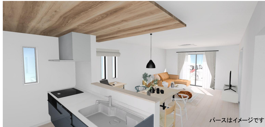
パースはイメージです。