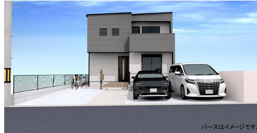
パースはイメージです。